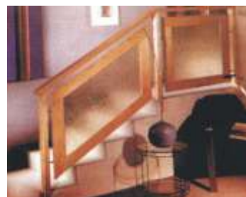
Prodotto termoplastico estremamente rigido, ottima lavorabilità.